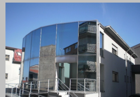
La nostra sede